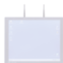
IPC Hochleistungs- Industrie-PC