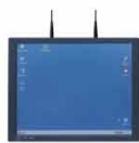
IPC Hochleistungs- Industrie-PC